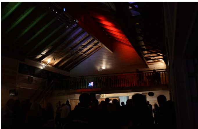
Fig: Bild på "Stora tältet"